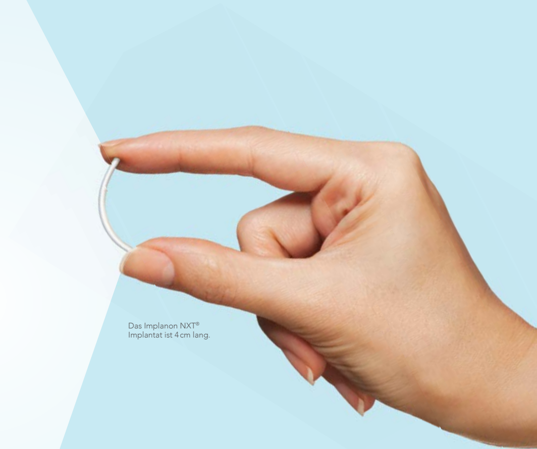
Das Implanon NXT® Implantat ist 4 cm lang.